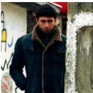
adjektiv biopremiär 5/3